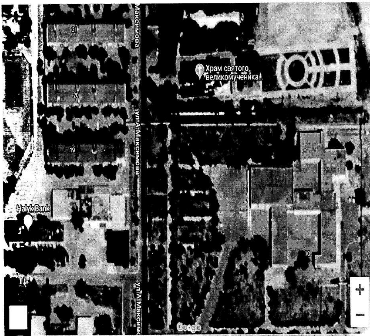
Схема объекта спорта

2.1. На территории ГБУ ДО ДЮСШ по адресу: улица имени генерал-полковника Максимова А.А. № 10а, расположен один спортивный объект: